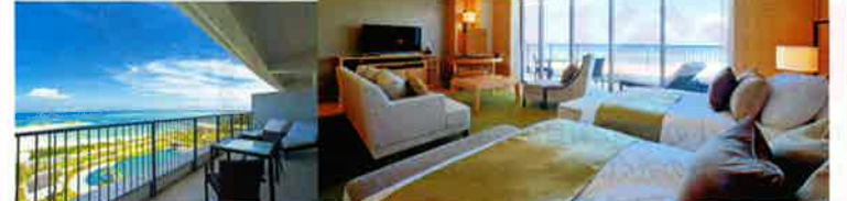
ベランダからの眺めが気持ちいい 66㎡の広さがあるクラブウイングのジュニアスイート

よりリゾート気分を 満喫できるクラブ ウイング。専用の屋内駐車場やラ ウンジなどがあり、16歳以上が 宿泊、利用できる。