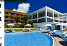
屋外プールからは海を一望できる

エメラルドビーチへは敷地内ゲートから歩いて3分。客室からはオーシャンビュー、またはパークサイドビューが楽しめる。レストランや宿泊ゲスト専用の屋外プールもある。