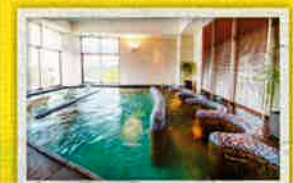
地下1500mから汲み上げた 海水を使ったクラブプール

クラブスパでリフレッシュ クラブウイング1階にあるクラブスパ 「ベルメール」は、太古の海水を活用し たプールやサウナを設ける。海産や海 泥を用いた、ボディパックなどのトリ ートメントも好評。利用は16歳から。