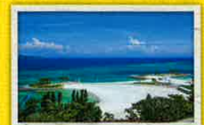
海洋博公園・エメラルドビーチ エメラルドビーチは沖縄の海の宝

景どころ満載の海洋博公園へ 沖縄美ら海水族館をはじめ、オキちゃん 劇場やエメラルドビーチなど、沖縄の必 見スポットが集まる海洋博公園は徒歩 圏内。無料で楽しめる施設もあるので、 いろいろ回ってみたい。