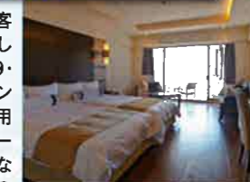
バルコニーにビューバスを設けたオーシャンプレミアムルーム

2014年7月、全客室をリフレッシュしたほか、新たに9・10階にオーシャンフロアが誕生。専用のアメニティやサービスが受けられるなど、ワンランク上のステイが楽しめる。