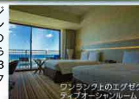
ワンランク上のエグゼクティブオーシャンルーム

美浜アメリカンビレッジ近くに誕生したヒルトンブランドのホテル。白のファブリックでまとめられた客室は3タイプ13種類ある。マリナクティビティも豊富。