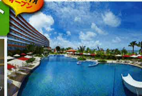
ウォーターライダーを備えるラグーンプール