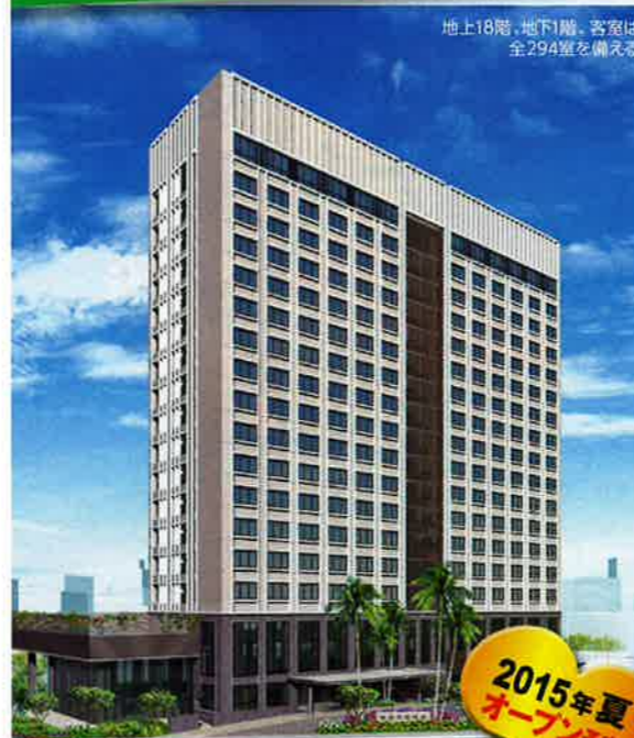
地上18階、地下1階。客室は全294室を備える

一度は泊まってみたい世界的に有名なホテルがついに沖縄に登場! ほかにも大型リゾートホテルが次々とオープン。充実したステイを演出してくれるNEWホテルをチェック!