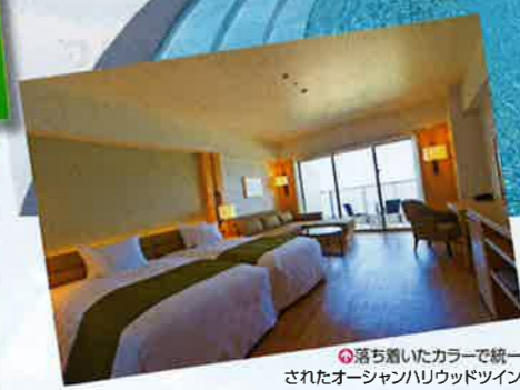
落ち着いたカラーで統一されたオーシャンハリウッドツイン

沖縄美ら海水族館に隣接する、大型のクルーズ客船をイメージしたホテル。伊江島が眺められる客室は、すべてバルコニー付きのオーシャンビュー。地下1500mから湧くもとぶ温泉やタラソSPA、プール、6つのレストランなど、設備も充実している。