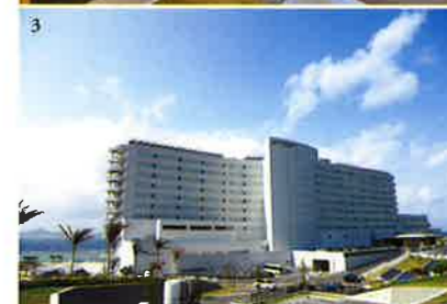
1) 沖縄の自然の恵みと、太古の海水を活用したタラソテラピースパ「タラソスパ ベルメール」。2) クラブウイングにある約66㎡のジュニアスイートルーム。3) 手前側が地上12階建ての高層棟・オーシャンウイングで、一番奥が16歳以上のみ利用可のクラブウイング